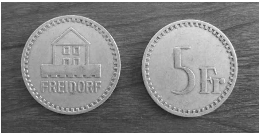
Bild 2: Freidorfgeld: Die 5 Franken-Marke aus Aluminium

Das Freidorfgeld als Diskussionsgegenstand erscheint im Rahmen des Aufbaues der Siedlungsgenossenschaft ein erstes Mal als „Markengeld“ am 10. Februar 1920 in der 17. Sitzung des Verwaltungsrates und es wird ein „Büchleinsystem in Verbindung mit Markengeld“ 13 vorgeschlagen. An der 26. Sitzung des Verwaltungsrats vom 20.06.1920, wird dies nochmals aufgegriffen und bestätigt. 14 Die am Nachmittag des gleichen Tages stattfindende Generalversammlung akzeptierte diese Idee, so dass an der darauffolgenden 27. Sitzung des Verwaltungsrats vom 29.06.1920 der endgültige Beschluss gefasst wurde: „Ausgabe von Konsumgeld. Der Verwaltungsrat beschliesst, Konsumgeld aus Aluminium anfertigen zu lassen und zwar je 3000 Stück von folgenden Sorten : 5 cts., 20 cts., 50 cts., 1 Fr., 5 Fr. Architekt Meyer wird ersucht, eine Zeichnung der Marken zu machen.“